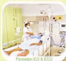
Perawatan ICU & ICCU