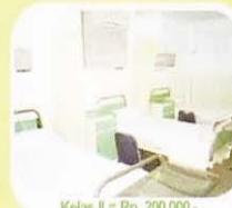
Kelas II = Rp. 200.000,-