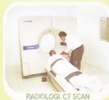
RADIOLOGI, CT SCAN