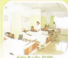
Kelas III = Rp. 80.000,-